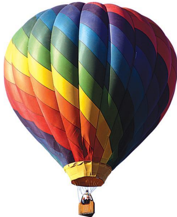
Balão de ar quente