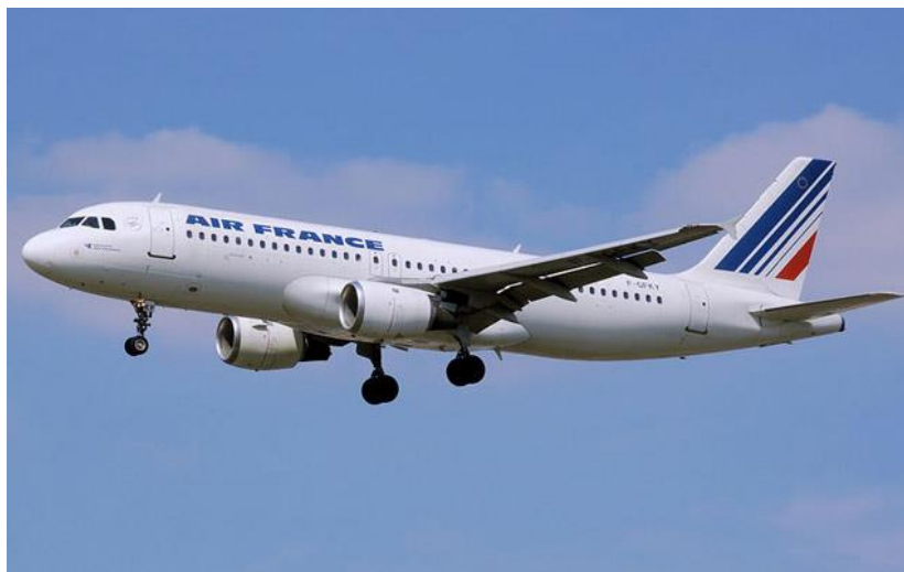
Avião de passageiros

Os transportes aéreos são os transportes que se movimentam na ar;